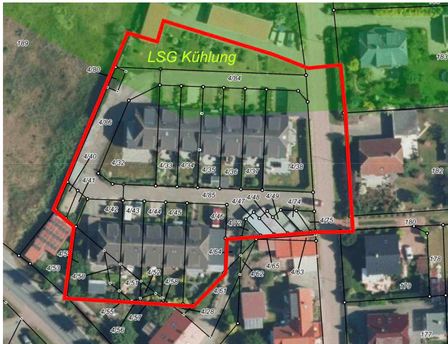
Abbildung 2: Darstellung Plangebiet mit Landschaftsschutzgebiet Kühlung

Der nördliche Teil des Plangebiets liegt im Landschaftsschutzgebiet Kühlung . Die Untere Naturschutzbehörde hat in ihren Stellungnahmen vom 07.04.2020 und 15.12.2020 die Herausnahme des nördlichen Plangebiets aus dem Landschaftsschutzgebiet auf Antrag der Gemeinde in Aussicht gestellt. Der Antrag auf Herausnahme aus dem Landschaftsschutzgebiet wurde von der Gemeinde am 02.02.2021 bei der Unteren Naturschutzbehörde des Landkreises Rostock gestellt. Die Grenze des Landschaftsschutzgebietes Kühlung wurde nachrichtlich übernommen.