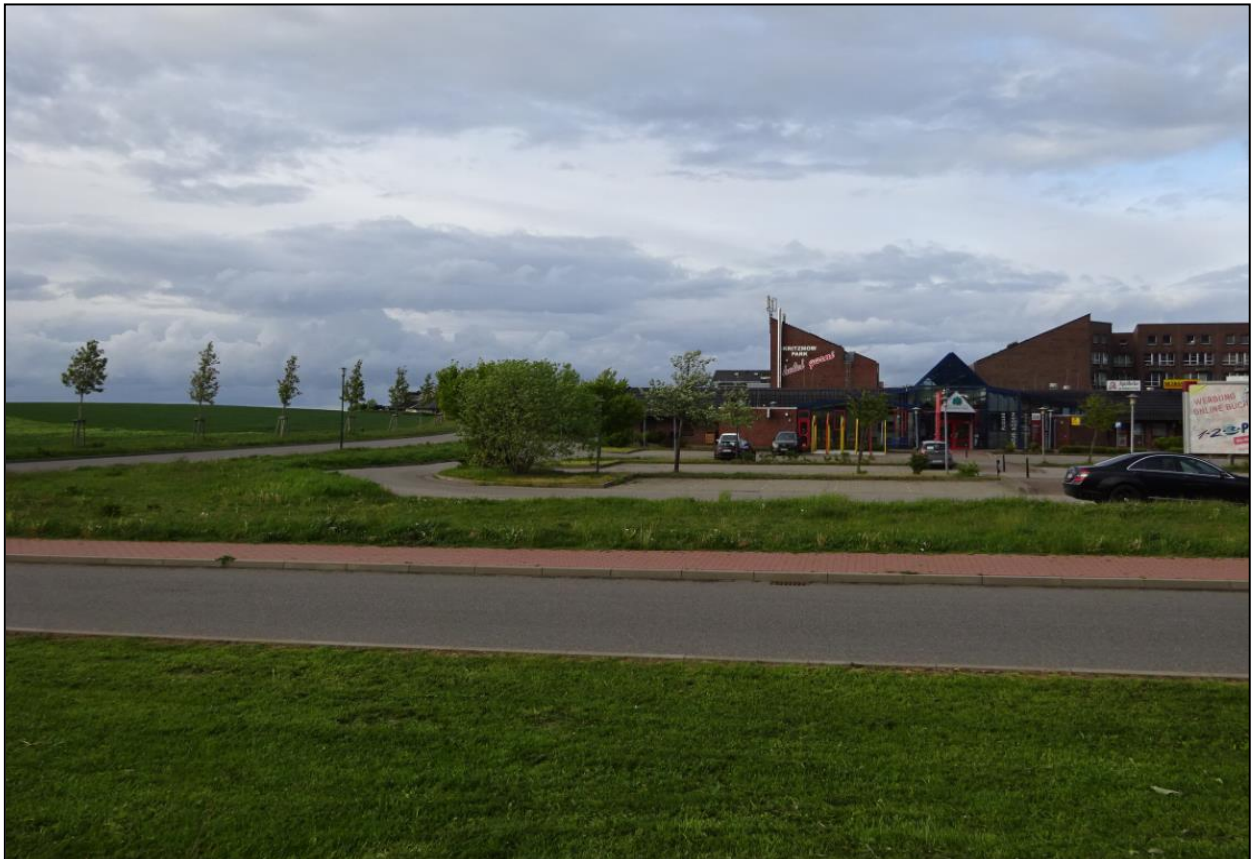
Abb. 2: Blick auf den angrenzenden Zanderweg und den Kritzmow Park östlich des Geltungsbereiches

Der Geltungsbereich des Bebauungsplans befindet sich im Westen der Ortslage Kritzmow. Er umfasst eine derzeit intensiv genutzte Ackerfläche, welche östlich an das Einkaufszentrum Kritzmow Park und südlich an einen weiteren Gewerbestandort anschließt. Nördlich erstrecken sich weitere Ackerflächen. Die Erschließung erfolgt über den „Zanderweg“.